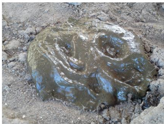
图3. 一头断奶犊牛的粪便，显示出SARA的迹象。

下一期《犊牛笔记》将探讨SARA对犊牛消化及能量利用的影响。我们还将分析SARA对犊牛健康（尤其是断奶后初期）的潜在影响。